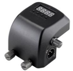
可加購 DMX 接收器